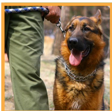
نمایش و معرفی سگهای سازمانی و نگهبان