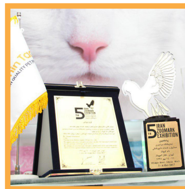
مراسم افتتاح و اهدای تندیس ها