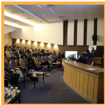
کارگاه های آموزشی اصول نگهداری و پرورش