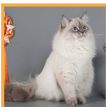
کارگاه ارزیابی گربه ایرانی (Persian Cat)