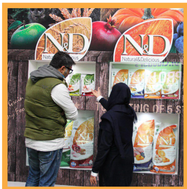
نمایشگاه حیوانات و محصولات، لوازم و خدمات دامپزشکی وابسته