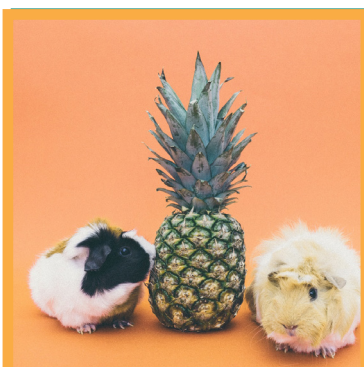
فستیوال خرگوش های پرورشی و جوندگان خانگی