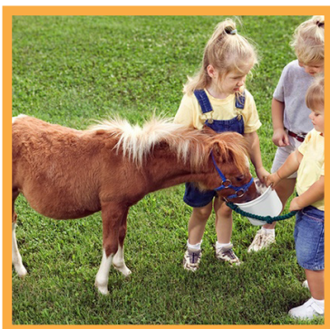
فستیوال کودک و اسب پونی