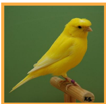
فستیوال زیباترین قناری ایران