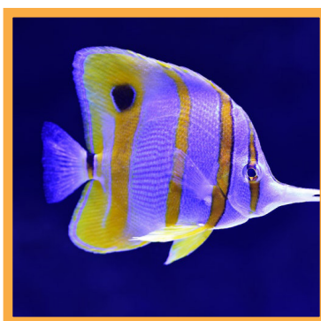
فستیوال آکواریوم و ماهیان زینتی