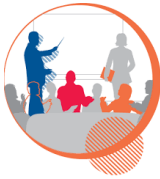
کارگاه های آموزشی

در بازار تکنولوژی و نوآوری نفت گاز و پتروشیمی، فروشندگان تکنولوژی فرصت می یابند تا ایده ها و تکنولوژی های خود را به معرض نمایش گذاشته و برای آن ها اقدام به بازاریابی نمایند. از طرفی این امکان نیز وجود دارد که متقاضیان تکنولوژی نیز تقاضاهای خود را مطرح نموده و به این صورت قدرت انتخاب بالاتری در بین گزینه ها داشته باشد.