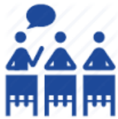
پنل های فنی و بازرگانی